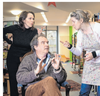
Ein wortlautes Plädoyer für den Müßiggang

Karten gibt es ab sofort im Vorverkauf für 7 Euro in der Stadtbücherei Bornheim, Servatiusweg 19-23, und in der Bornheimer Bücherstube, Königstraße 79. Reservieren kann man telefonisch unter 02222 938-565.