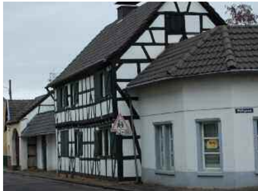
■ Auch bei schwierigen Fällen, wie bei einem Fachwerkhause, lohnen sich Sanierungsarbeiten. Doch gerade hier ist der Rat des Fachmanns unbedingt notwendig.

Wer Fragen hat, wie die Behaglichkeit in den eigenen vier Wänden gesteigert und Energie gespart werden kann, wendet sich an die anbieterunabhängige Energieberatung der Verbraucherzentrale im Bornheimer Rathaus. Freie Termine gibt es noch am 07.03., 11.04. und 09.05.2012.