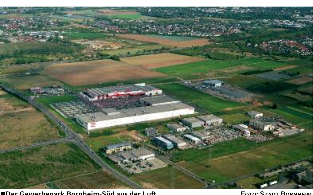
Der Gewerdepark Bornheim-Süd aus der Luft

Der erfolgreiche Strukturwandel und die Schaffung neuer Arbeitsplätze in der Stadt Bornheim ist nach wie vor ein sehr dynamischer Prozess, wie die zahlreichen Unternehmensansiedlungen in den letzten Monaten zeigen. Die aktuellen Arbeitsmarktdaten für die Stadt Bornheim belegen diese Dynamik und spiegeln die äußerst positive wirtschaftliche Entwicklung in der Stadt Bornheim wieder. So ist die Arbeitslosenquote mit 3,9% für die Stadt Bornheim auf einem Rekordtief. Ein Vergleich mit den Monatsvorjahreswerten zeigt, dass die absolute Zahl der Arbeitslosen (Leistungen nach SGB III und SGB II) von insgesamt 1.241 auf 956 in der Stadt Bornheim, d. h. um 23% abgenommen hat. Dies deckt sich mit der Entwicklung der sozialversicherungspflichtig Beschäftigten in der Stadt Bornheim, welche seit